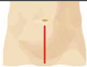
Incisiones en la prostatectomía quirúrgica tradicional

El Sistema quirúrgico da Vinci es una sofisticada plataforma robótica compuesto por una consola, una torre endoscópica y un carro de 4 brazos articulados diseñada para realizar operaciones en localizaciones anatómicas de difícil acceso (pélvis masculina o femenina) de una forma poco invasiva a través de mínimas incisiones (1-2 cms).