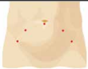
Incisiones en la prostatectomía robótica da Vinci